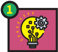
High Technology Teknologi Tinggi